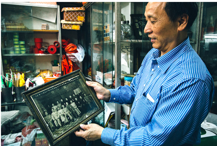
▲ 兒子金華拿著的，是梁師傅在「港九油燭藝術札作職工會」的合照。

梁師傅又跟新馬師曾等老信相熟，看戲從來不用花錢。鄧麗君剛出道時，便羨名向他訂製宣傳花燈。粵語長片《大鬧水晶宮》所用的戲服和道具，戲中蚌精的貝殼、蝦精的蝦頭，亦由梁師傅製成。政府舉辦的綵燈會，歷史博物館的紮作展覽，都有梁師傅的作品。最威風的是他在1984年創下世界紀錄，紮出七米高的「八仙賀壽」花燈，以此名揚天下，行內無出其右。兒子打趣道：「佢咁威，我咁咪有飯食囉」，自豪之情溢於言表。