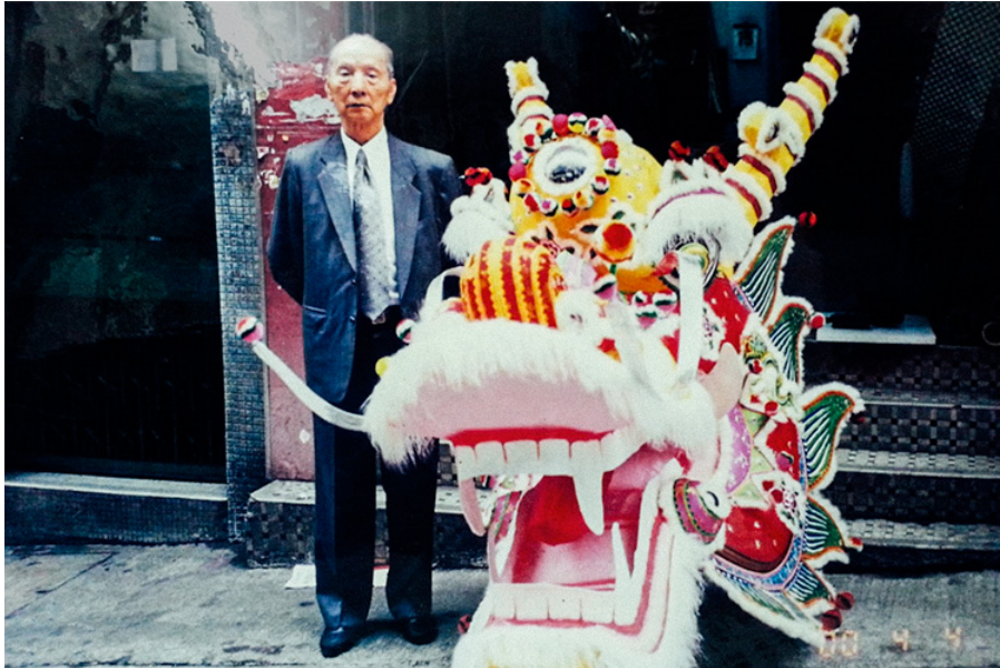
▲ 梁師傅為英女皇加冕慶典製作的金龍，光是龍頭已高似人身。

梁師傅一生「威水史」甚豐，無論僑民、鄉下人，還是富商和政府部門，都很喜歡他。當年英女皇伊利沙伯二世加冕，慶祝大典上出現的180呎金龍，正是梁師傅所紮。香港辦過幾次滿漢全席，梁師傅便兩度負責製作小型紙紮品，桌上的假山和牌坊模型，均出自其手。連商場門外的聖誕老人裝飾，每條鬍子也是他人手紮成的。往日富豪家中若有紅白二事，便會拜託梁師傅佈置一番，李嘉誠、鄧肇堅都曾是他的客人。